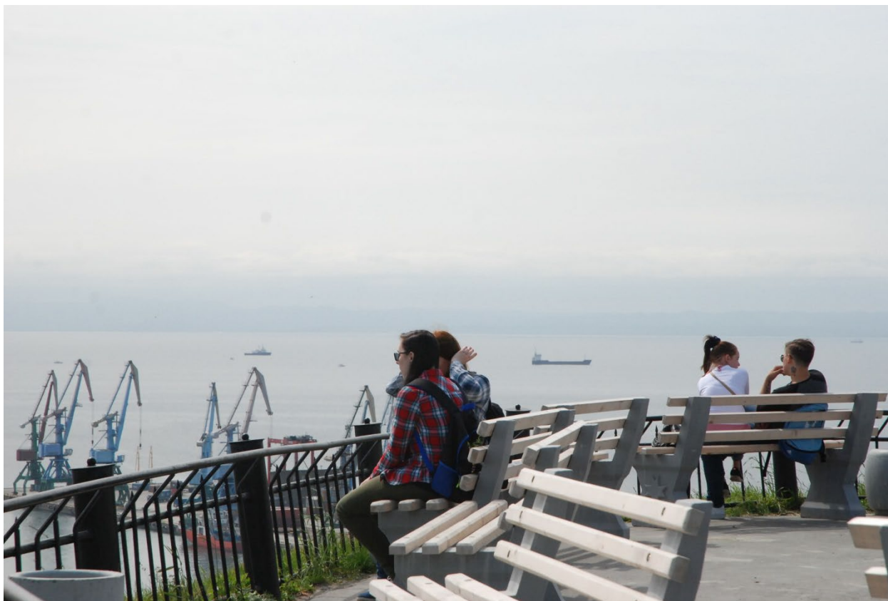
Корсаков. Вид на Анивский залив

Как утверждает Крузенштерн, общение Резанова с японцами, промышленявшими торговлей с айнами на Южном Сахалине, происходило без особых трудностей. За время долгого сидения в Нагасаки Резанов не только выучил японский язык, но и составил один из первых русско-японских словарей, кроме того «Руководство к познанию японского языка».