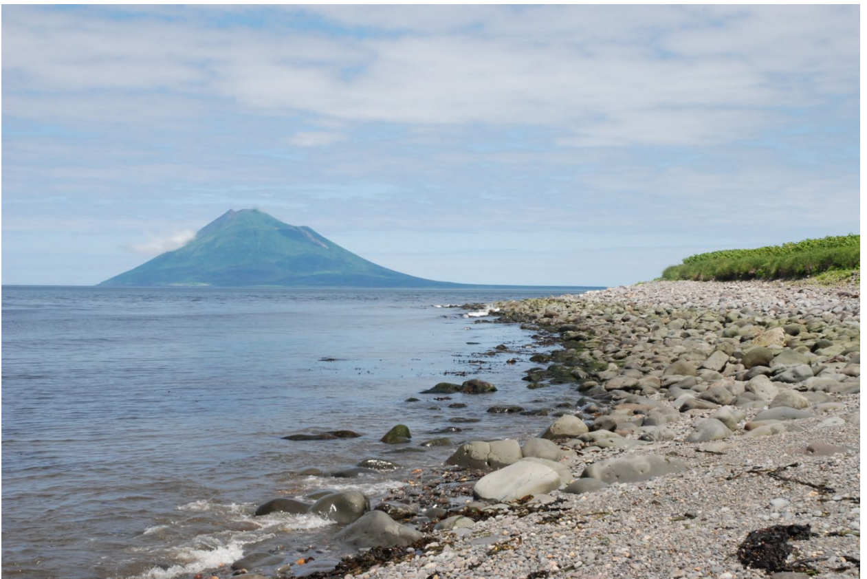
Итуруп. Вулкан Атсонопури