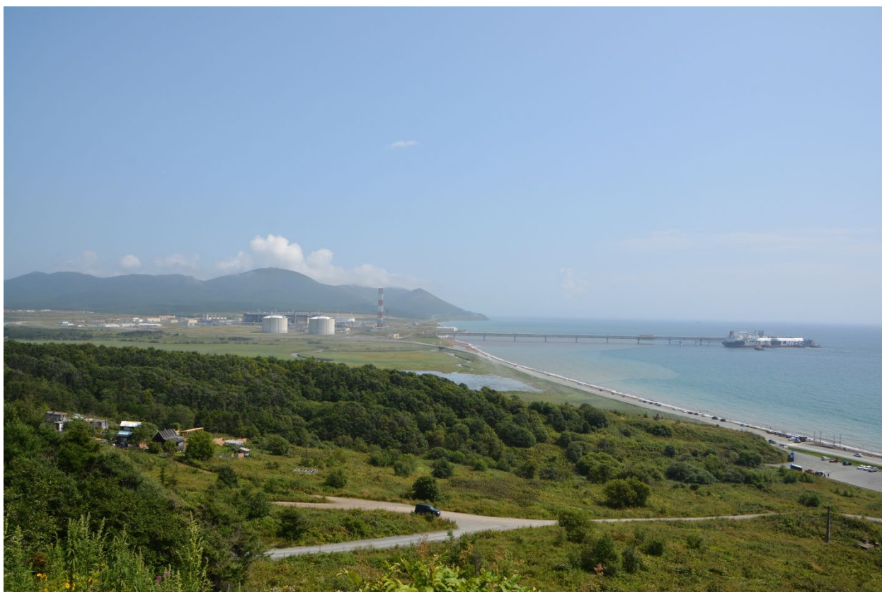
Сахалин. Сопки Юнона и Малая Юнона