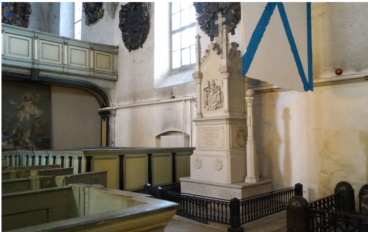
Надгробие над прахом Крузенштерна в Домском соборе Таллина

В Домском соборе Таллина установлено надгробие над прахом Крузенштерна. На барельефе надпись: «Первому русск. плавателю вокруг света» — 1803-1806».