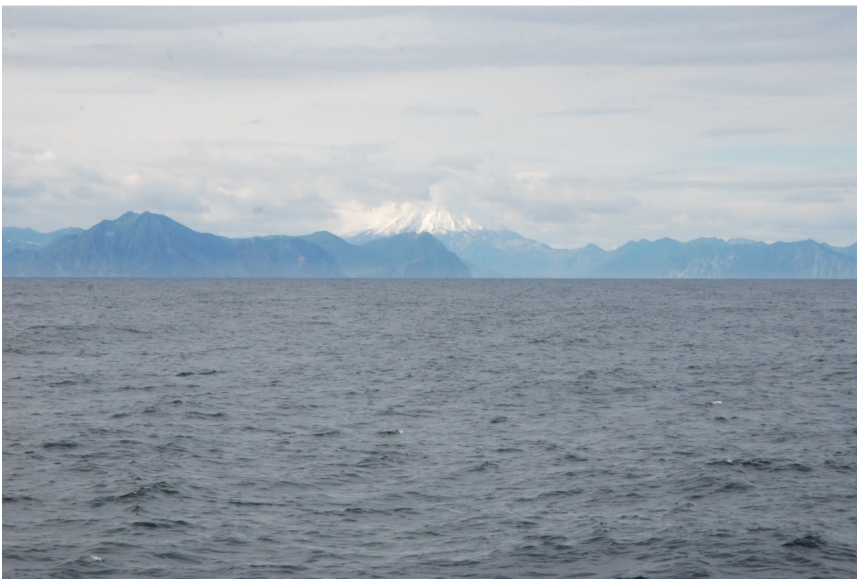
У берегов Камчатки