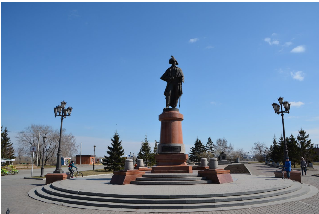
Красноярск. Памятник командору Резанову

В августе 2007 года в Красноярске на площади Мира был создан мемориальный комплекс Н.П.Резанову, включающий в себя памятник командору Резанову (авторы Андрей Касаткин и Константин Зинич), и кенотаф — копию надгробного памятника, установленного в XIX веке на могиле Резанова. На месте усадьбы Родюкова в Красноярске (на углу комплекса «Метрополь»), в которой умер Резанов, размещена мемориальная доска.