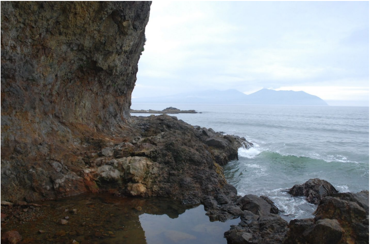
Итуруп. Бухта Касатка.