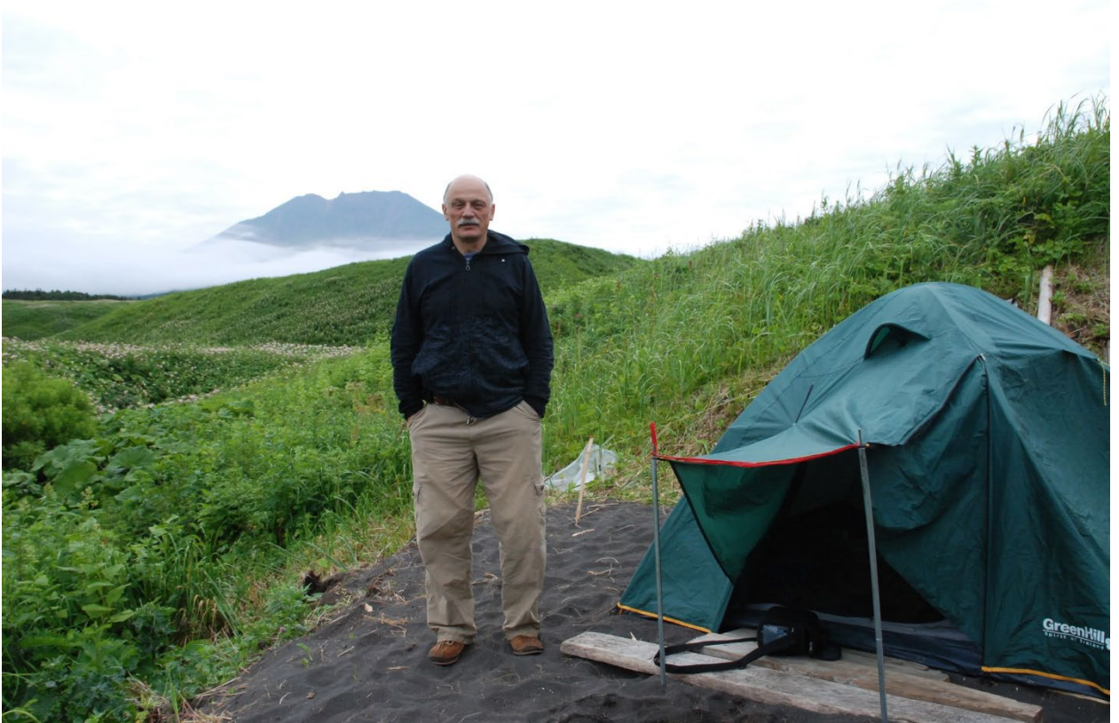
Итуруп. Бухта Одесская