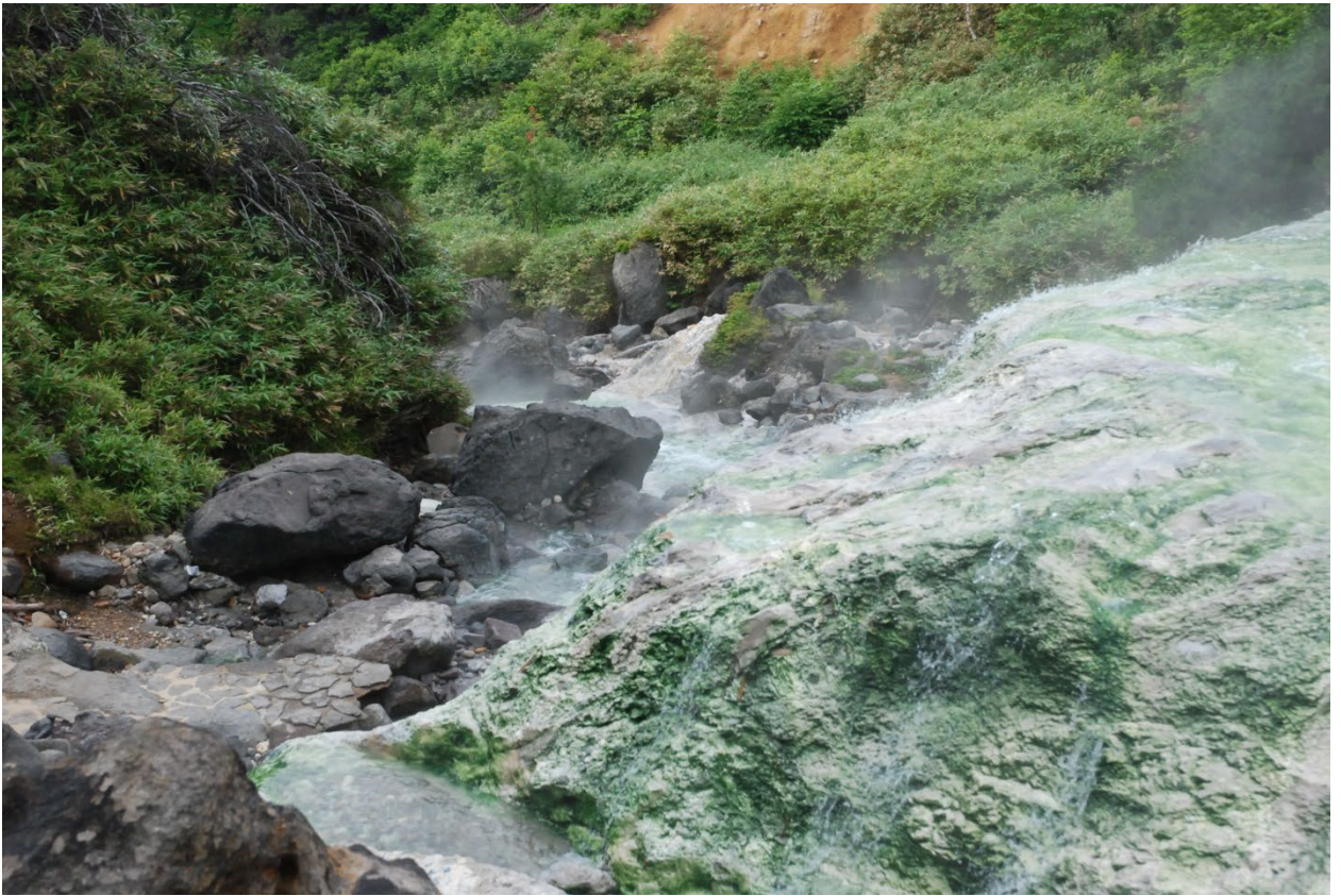
У подножья вулкана Баранского